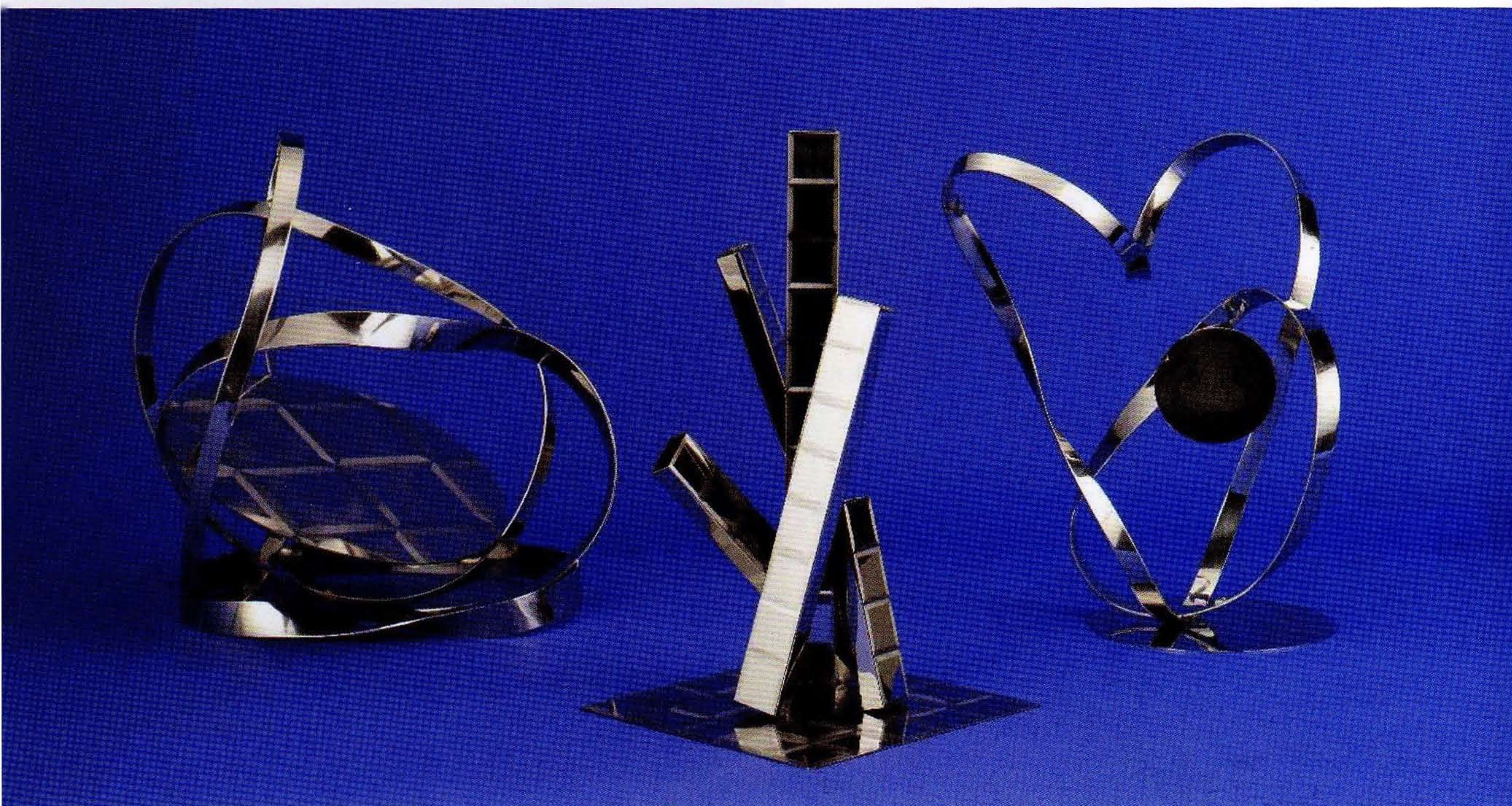
「時の経過」〈ステンレスオブジェ〉

このオブジェは過去・現在・未来を表現しています。 中央に凛と立つ現在の象徴に過去も未来も寄り添って一体になっています。 過去があるから現在がある。まるで現在は過去と未来を結ぶ架け橋のようだ。 繰り返す自然の摂理や輪廻の中で展望を抱きながら未来はどんな記憶を残してくれるのでしょうか？ フィルムパターン（格子柄）やRipple marks（砂紋）などの研磨手法を施しています。（秋谷）